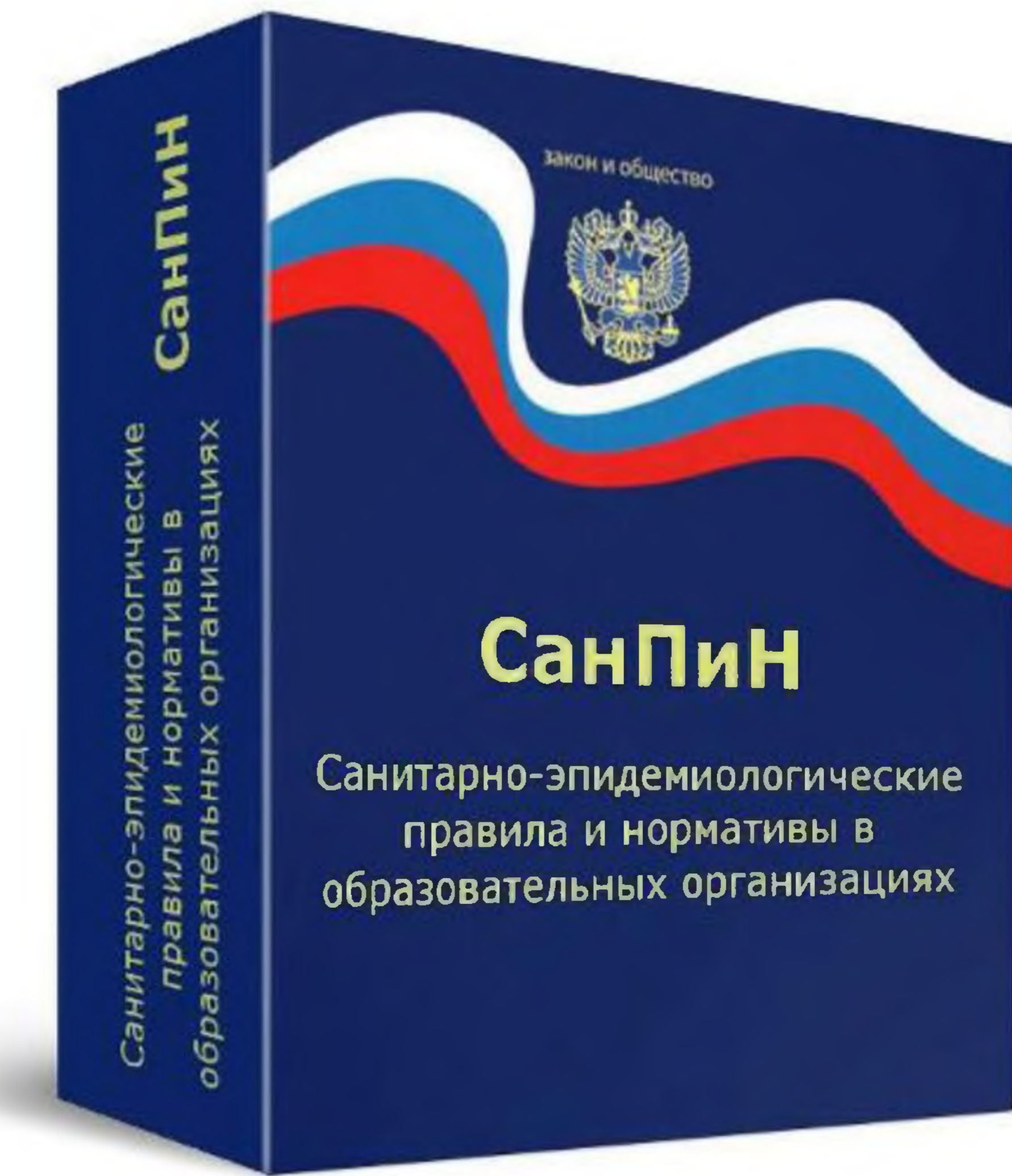
Санитарно-эпидемиологические правила и нормативы СанПиН 2.4.2.2821-10 утратили свою силу с 1 января 2021 года

Обращаем внимание на то, что при любой температуре образовательная организация обязана организовать учебный процесс для любого количества обучающихся, в частности правовых оснований отмены учебных занятий из-за сильных морозов в настоящее время не имеется.